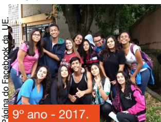
Página do Facebook da UE.