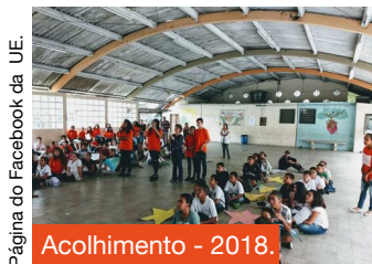
Página do Facebook da UE.

No dia primeiro de fevereiro, os novos alunos da escola participaram do acolhimento realizado pelos laranjinhas. Em uma das brincadeiras, tinham que falar seus nomes, o nome da escola antiga, e um sonho. Ao terminarem as apresentações, entregavam uma bala para a pessoa que queriam que se