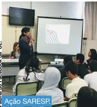
Página do Facebook da UE.