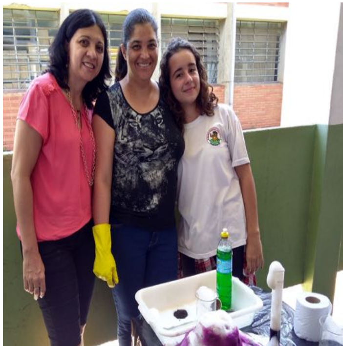
JOÃO XXIII 2018