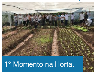
1º Momento na Horta.