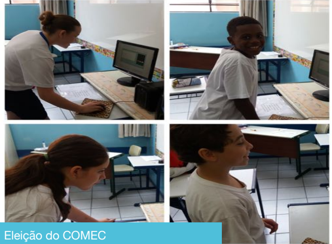
Eleição do COMEC

processo democrático e enriquecedor na rotina da nossa escola. Os alunos votaram com consciência, procurando escolher o melhor representante para a turma. Dos cerca dos duzentos e dez votos, apenas um foi nulo. Não houve registro de votos em branco. As crianças respeitaram as regras da eleição: não divulgaram seu voto e nem fizeram "boca de urna". Houve empate em duas turmas, sendo necessária uma nova eleição para definir o representante. Sendo assim, uma nova eleição foi realizada,