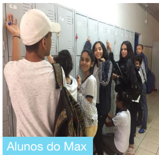
Alunos do Max

Os armários na escola são bem úteis para os alunos. “Eles nos auxiliam muito em nosso cotidiano, pois não temos que carregar tanto peso e podemos nos organizar melhor”, dizem os alunos. A gestão junto a APM se articulou para implementar novos armários, afinal a escola é de ensino integral e os alunos utilizam diversos materiais escolares.