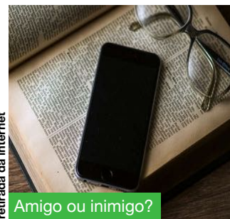
Amigo ou inimigo?

A impaciência, menor autocontrole e desatenção são sintomas a serem investigados. A introdução dos aparelhos deve ser controlada e orientada pelos professores, pois ao integrar as novas mídias às aulas é preciso saber dosar e direcionar o uso de celulares. Portanto, é necessário o monitoramento dos estudantes em relação ao uso desses aparelhos e outros eletrônicos, respeitando os combinados da escola.