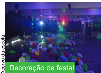
Acervo da escola

A parte fechada, pois ficou muito calor lá dentro. Gostei do açaí. Não sugiro nenhum tema