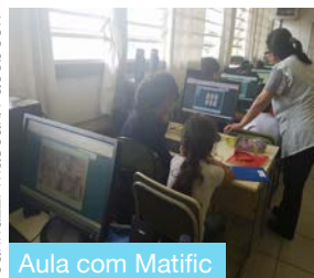
Aula com Matific