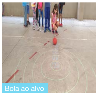
Bola ao alvo

Para que o ensino de alunos dos primeiros e segundos ficasse mais interessantes, as professoras planejam aulas com brincadeiras sem esquecer da aprendizagem. no dia-a-dia crianças entre 6 , 7 e 8 anos se juntam em meio de brincadeiras que tem contas, contos, textos de ciências, mapas e a nossa história do Brasil. Uma ideia que as crianças se ligam bastante!