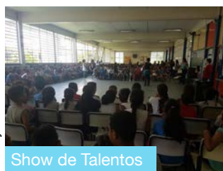
Show de Talentos