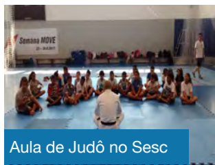
Aula de Judô no Sesc