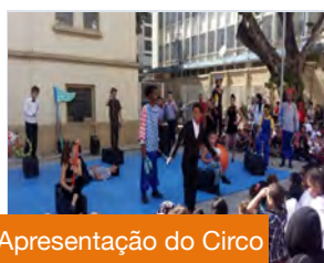
Apresentação do Circo

na canção de Jair de Oliveira, “Normal é ser diferente”. Os estudantes do 2ºano D escreveram um conto baseado no vídeo: “É preciso ceder, para viver bem com todos.