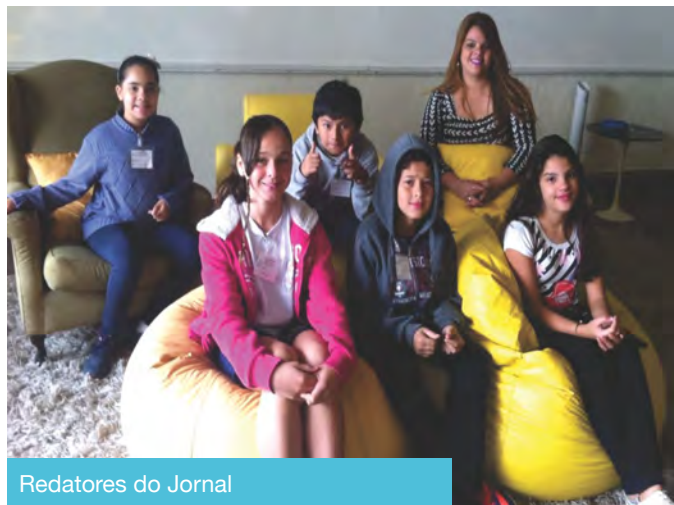
Redatores do Jornal

Como resultado desse processo, nasceu o esperado JC, JORNAL DO CONSELHEIRO! Esperamos que esse projeto seja um meio de comunicação, troca de experiências, informações, entretenimento e aproximação entre a escola e a comunidade.