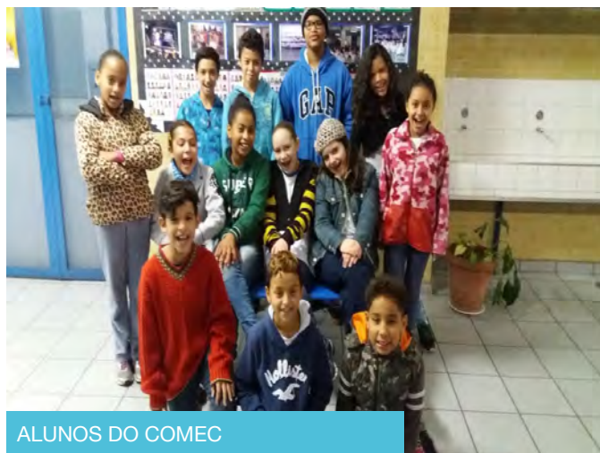
ALUNOS DO COMEC