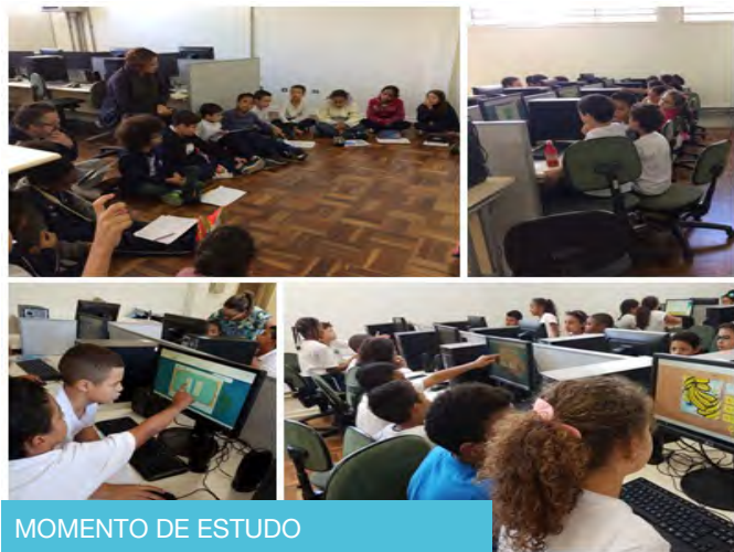
MOMENTO DE ESTUDO